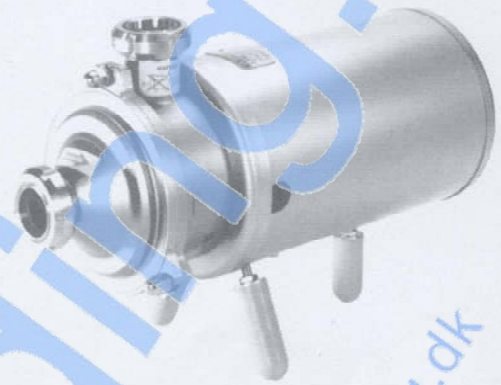
Fig. 1. MR-166B væskeringspumpe.

D) Produktberørte pakninger af Nitril (NBR) eller Viton (FPM).