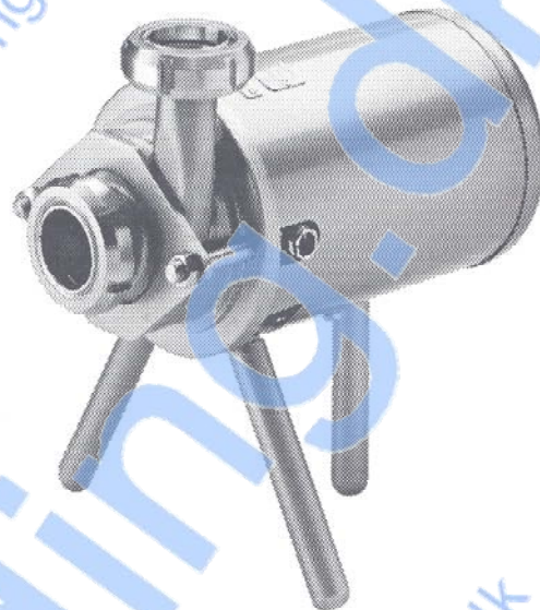
Fig. 1. FM-0 med kappe og ben.