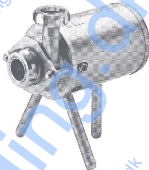
Fig. 1. FM-0 med kappe og ben.