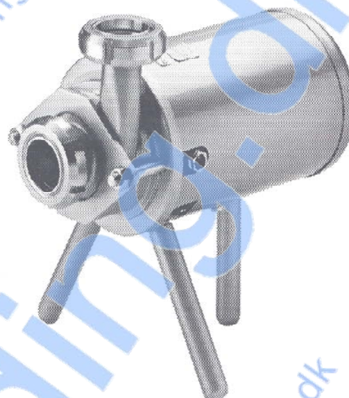
Fig. 1. FM-0 med kappe og ben.