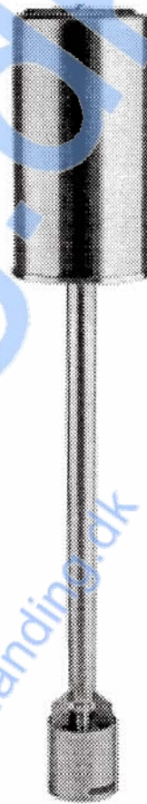
Fig. 1. LKRE, Røreværk.